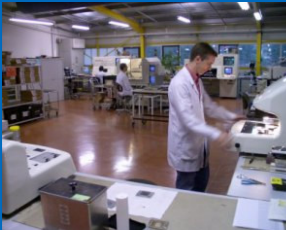
SMT avec rebillage