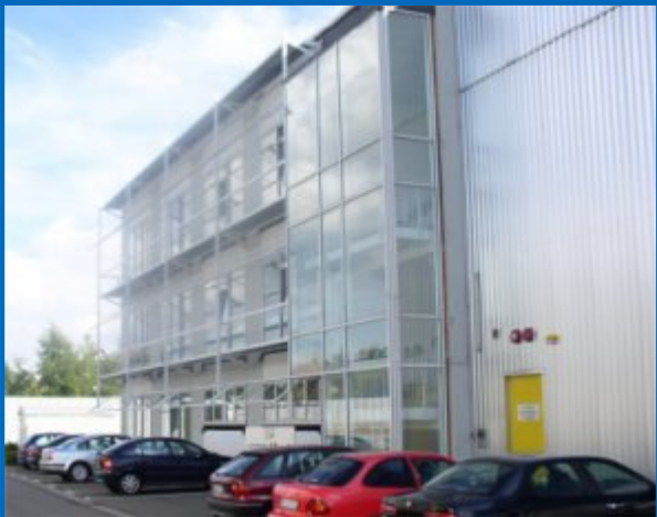
Extérieur bâtiment GROSSOSTHEIM

NSE Services est présente à GROSSOSTHEIM près de Francfort depuis Juillet 2003 .